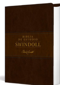
Biblia de estudio Swindoll NTV