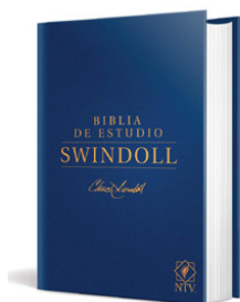
Biblia de estudio Swindoll NTV