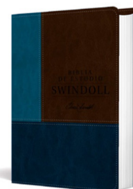
Biblia de estudio Swindoll NTV