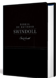
Biblia de estudio Swindoll NTV