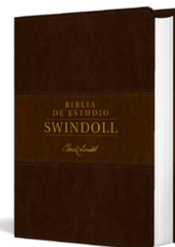
Biblia de estudio Swindoll NTV