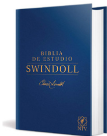
Biblia de estudio Swindoll NTV