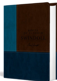
Biblia de estudio Swindoll NTV